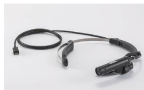
実用新案登録第 3218097 号